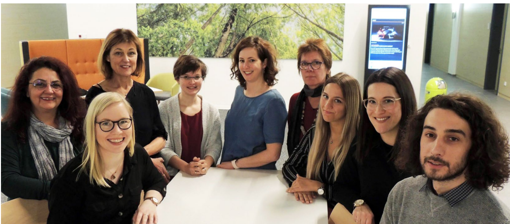
Ihr Team des Dienstleistungszentrums Bildung

Wir haben uns bemüht, alle interessanten und hilfreichen Stichworte, Links und Adressen mit aufzunehmen. Sicherlich haben wir dabei das ein oder andere übersehen und sind daher auf Ihre Mithilfe angewiesen. Der Dortmunder Bildungswegweiser wird einmal jährlich aktualisiert und ergänzt. Sollten Sie Ergänzungs- oder Änderungswünsche haben, senden Sie uns gerne eine E-Mail: dlzb@stadtdo.de . Auf Seite 82 finden Sie dazu auch ein entsprechendes Formular.